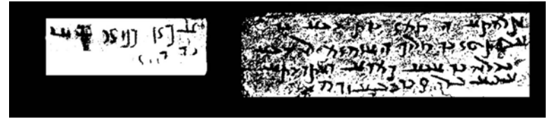
ڪنزي بن ابي سمي بنت كجا

سمي بنت كجا جي مجسمي واري عبارت ڪنزي بن ابي واري عبارت